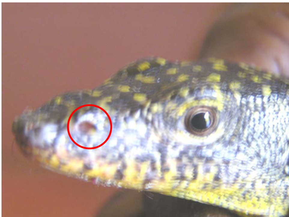
Gambar 1. Penampang muka biawak dan bentuk lubang hidung.